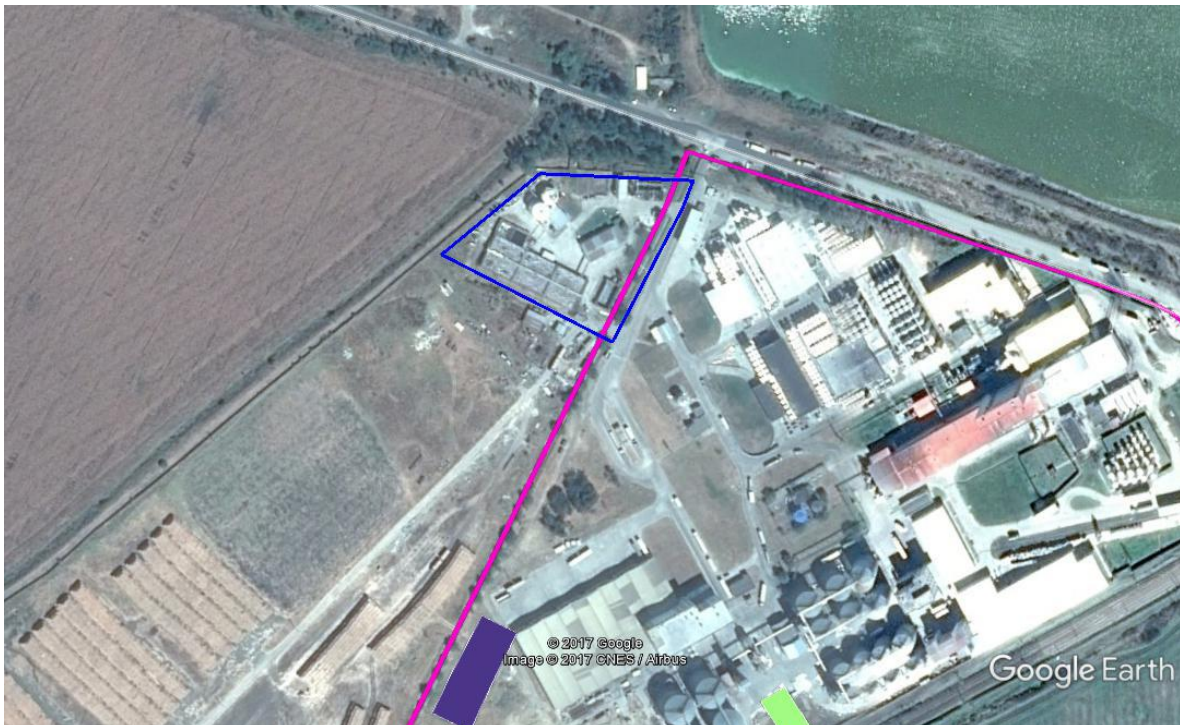
Фиг. 5.3 Урбанизирани територии в УЗ Пп_1 (имот с № 10625.127.2), със син контур и площ 1,27 ха. в границата на 33 „Комплекс Стралджа” (червената линия)