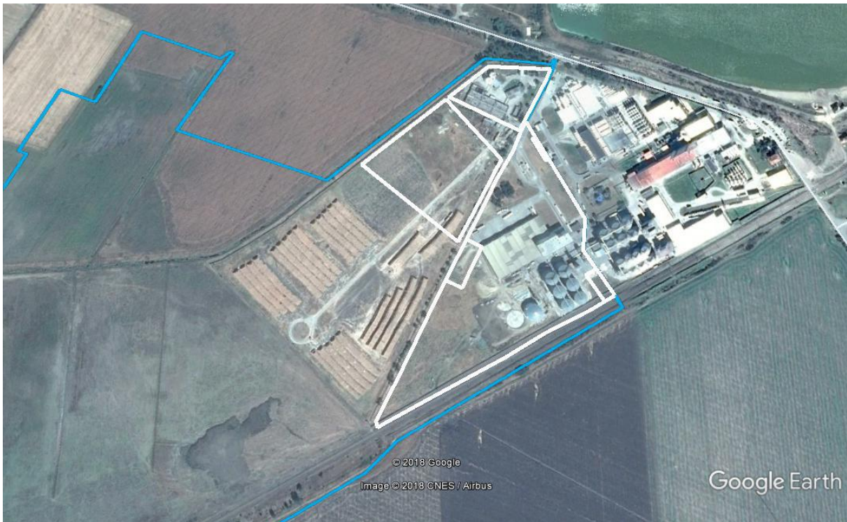
Фиг. 5.1. Съществуваща урбанизирана УЗ, югозападно от яз. Церковски (Пп_1 – бял контур) заемаща площ от 11,58 ха в ЗЗ „Стралджа” (син контур – граници на ЗЗ „Стралджа”)

Оценка на въздействието: Единствената УЗ в землището на с. Венец (Пп_1), попадаща на територията на ЗЗ (фиг. 5.1) е съществуваща и урбанизирана с вече изградена инфраструктура и ограда. Не се предвижда нейното разширяване. Независимо от близостта си с микроязовира, тя не представлява потенциално местообитание на видрата, напълно отсъстват условия за убежища. ОУП е без пряко или косвено въздействие (степен 0).